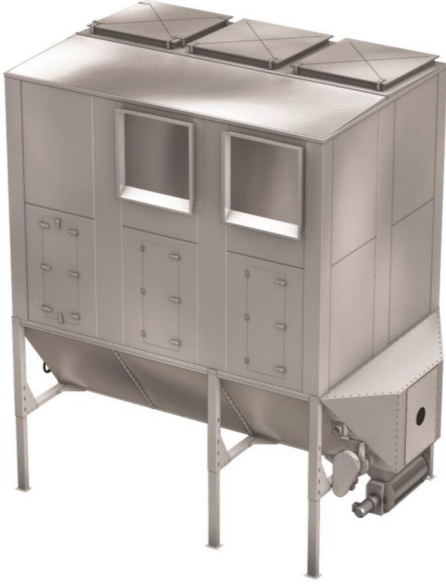
Example: NFKZ3000 2+1 HJ filter with side and top venting for St2 dust

Yoğun malzeme kirliliği seviyelerine sahip geniş miktarda havanın taşınması için uygun torba filtreli toz toplayıcıdır.